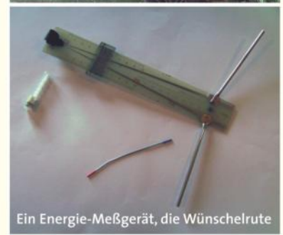
Ein Energie-Meßgerät, die Wünschelrute

Die Seen sind wieder klar und man kann die Bälle auf dem Grund sehen.